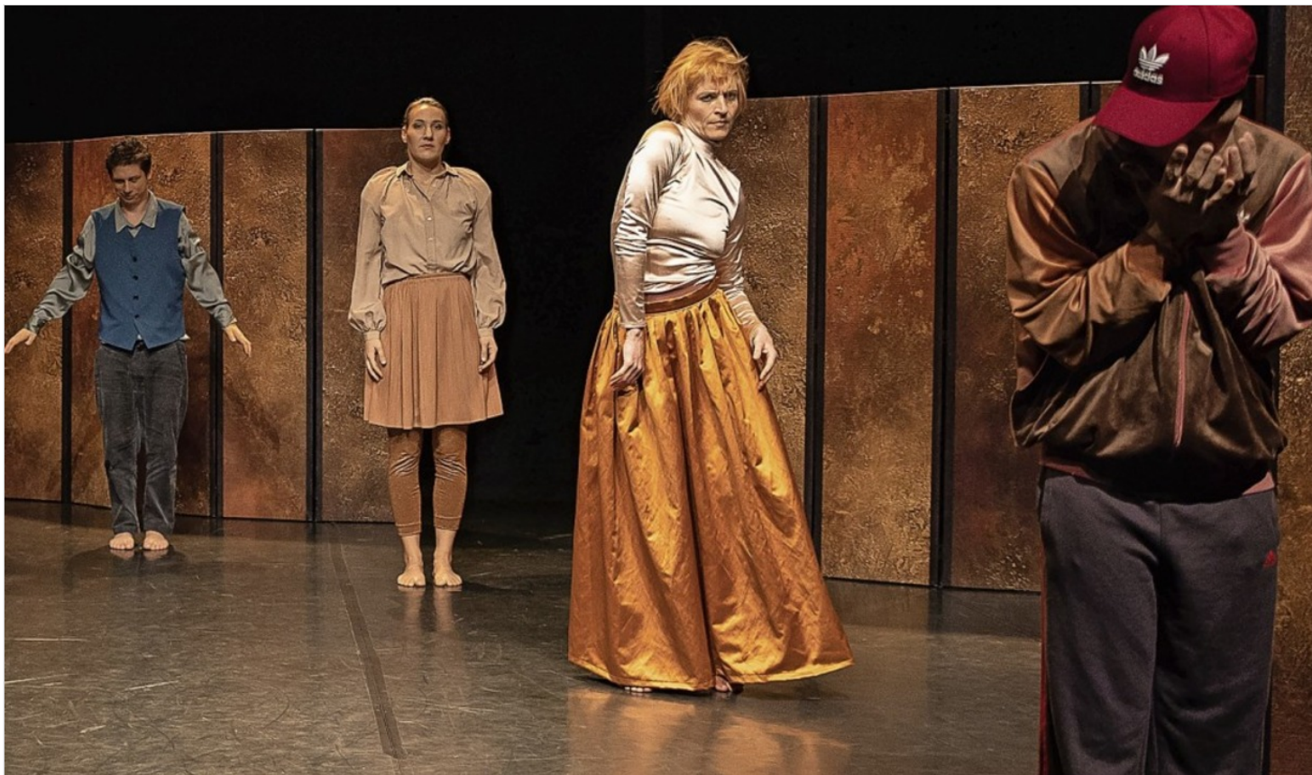
Märchenhafter Raum: Szene aus „Eden“

Auftakt einer Trilogie des inklusiven Ensembles com.dance.